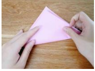
yǐ duì jiǎo wéi zhōng xīn xiàn duì lǎ yě jiù shì líng wài de Figure 1: 以對角為中心綫對摺，也就是另外的 liǎng gè jiǎo wán quán wěn hé lǎ qǐ rán hòu zhāng kāi líng wài liǎng 兩個角完全吻合摺起。然後張開。另外兩 jiǎo de duì jiǎo xiàn yě yī tóng fǎ lǎ chū yī tiáo zhí xiàn zhèi gè dòng 角的對角綫也以同法摺出一條直綫。這個動 zuò de mù de shì yào jīng què dì zhǎo chū zhōng xīn zhān 作的目的是要精確地找出中心點。