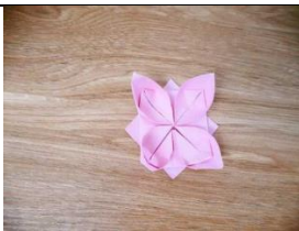
zhèi jiù shì yī duǒ wán chéng de lián huā Figure 9: 這就是一朵完成的蓮花。