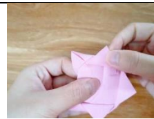
bǎ huā bàn xià biān yè zǐ xíng de huā tuō biān yán yě zhěng lǐ Figure 8: 把花瓣下邊葉子形的花托邊沿也整理 hǎo 好。