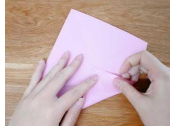
bǎ jiǎo dǐng zhān duì zhǔn zhōng xīn lǎ qǐ sì gè jiǎo dōu zhèi mó Figure 2: 把角頂點對準中心摺起。四個角都這麼 zuò 做。