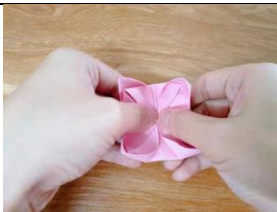
bǎ sì gè huā bàn dōu zuò hǎo Figure 7: 把四個花瓣都做好。