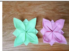
duō zuò jǐ duǒ bǎi zài yī qǐ jiù hěn hǎo kàn le Figure 10: 多做幾朵擺在一起就很好看了。