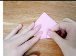
bǎ zhǐ fān zhuǎn guō lái zài zuò yī cì Figure 4: 把紙翻轉過來，再做一次。