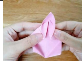
měi fān zhuǎn yī gè bǎ jiǎo jiān zhān hé liǎng biān huā bàn zhěng Figure 6: 每翻轉一個，把角尖點和兩邊花瓣整 lǐ yī xià 理一下。